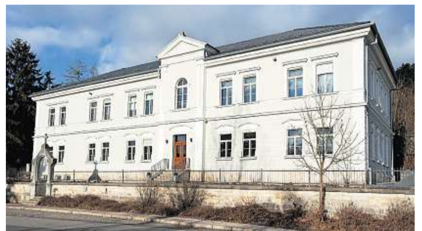
Ihren Firmensitz hat die Brundobler GmbH in Kelheim.