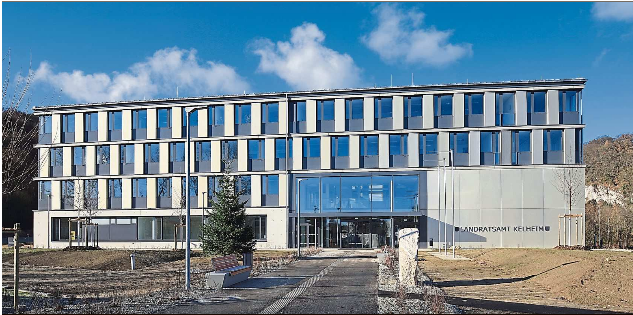
Das neue Landratsamt Kelheim.